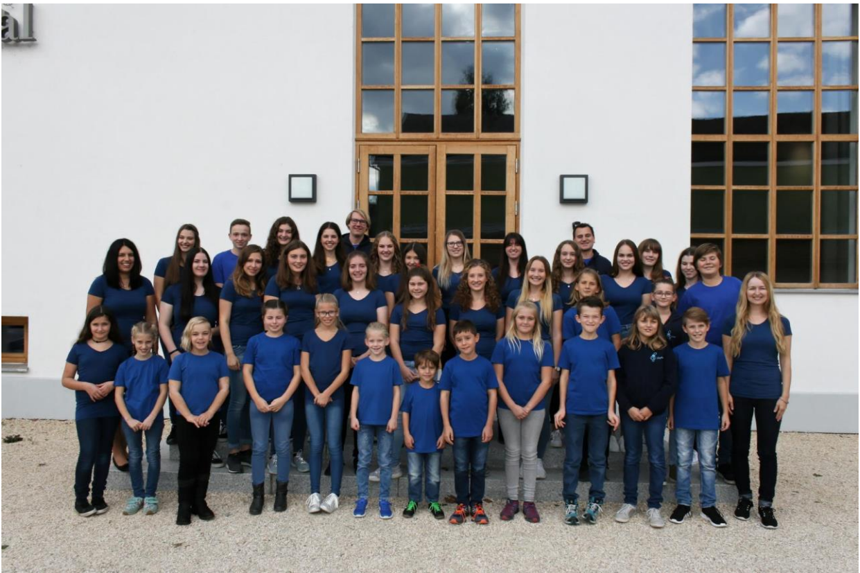
Jugendkulturpreisträger: der Kinder- und Jugendchor „SaMis“.